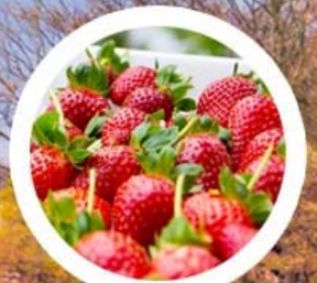
ชิมสตอเบอร์รี่สดๆ จากไร่