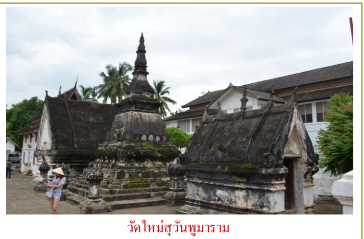
วัดใหม่สุวรรณภูมาราม