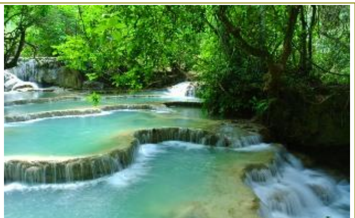
น้ำตกกวางสี