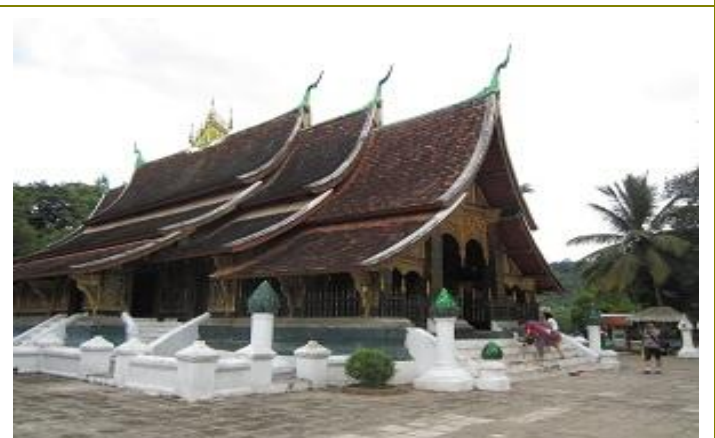
วัดเชียงทอง