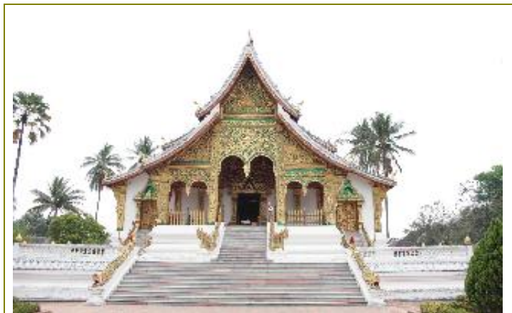
พระราชวัง และ หอพิพิธภัณฑ์หลวงพระบาง