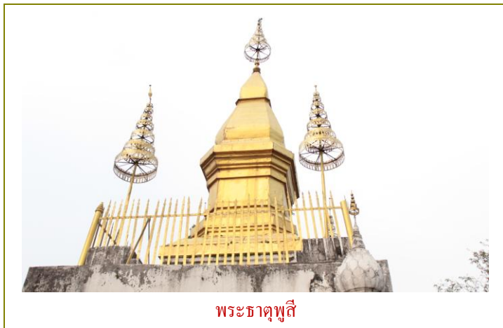
พระธาตุพูสี