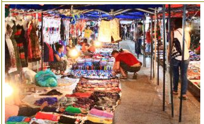
บรรยากาศตลาดกลางคืน