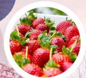
ชิมสตอเบอร์รี่สดๆ จากไร่