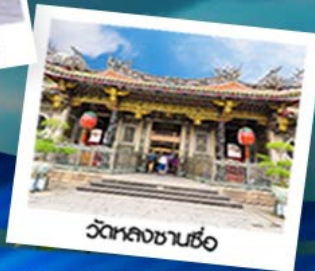
วัดหลงซานซื่อ