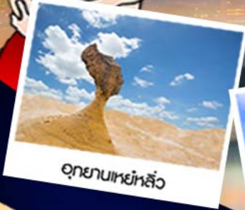
อุทยานเหยี่ยวหลิว