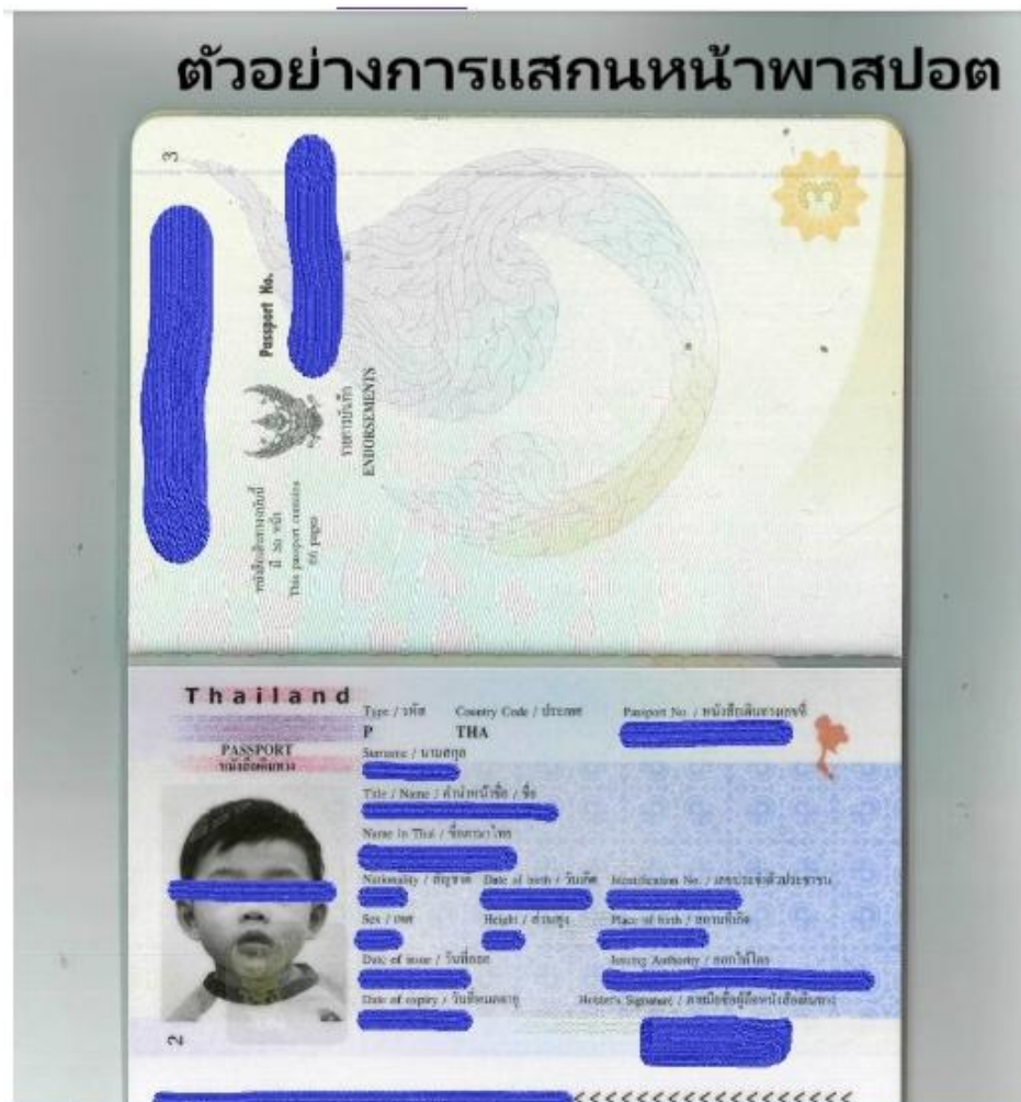
รูปตัวอย่าง ต้องพื้นหลังสีขาวเท่านั้น