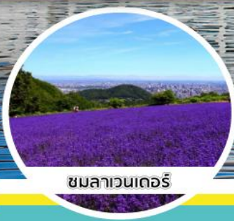
ชมลาเวนเดอร์