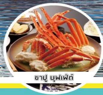
ซาซิมิ ซูชิ